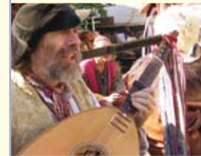
Ritter an der Nahe