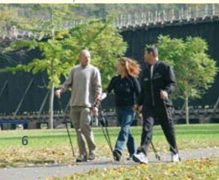
Wer Nordic Walking liebt, kommt bei uns ganz auf seine Kosten.