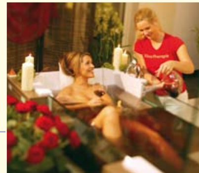
Wellness mit Wein - auch das ist an der Nahe möglich.

Versuchen Sie es doch einmal mit Nordic Walking: Sechs verschiedene Touren führen Sie durch das Salinental. Dabei atmen Sie die heilsame frische Luft aus den Gradierwerken ein, Europas größtem Freiluftinhalatorium.