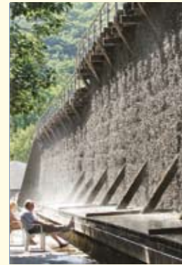
Frische Brise im Salinental

Und wenn es noch ein wenig Wellness sein darf, verwöhnen Sie die drei Nahekurorte Bad Kreuznach, Bad Münster am Stein-Ebernburg und Bad Sobernheim mit ihren Angeboten. Baden Sie bei der Vinotherapie im Wein, und genießen Sie anschließend eine Aromaöl-Massage mit Riesling!